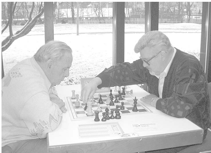
Blitzturnier: Beliebt im Beiprogramm der Senioren