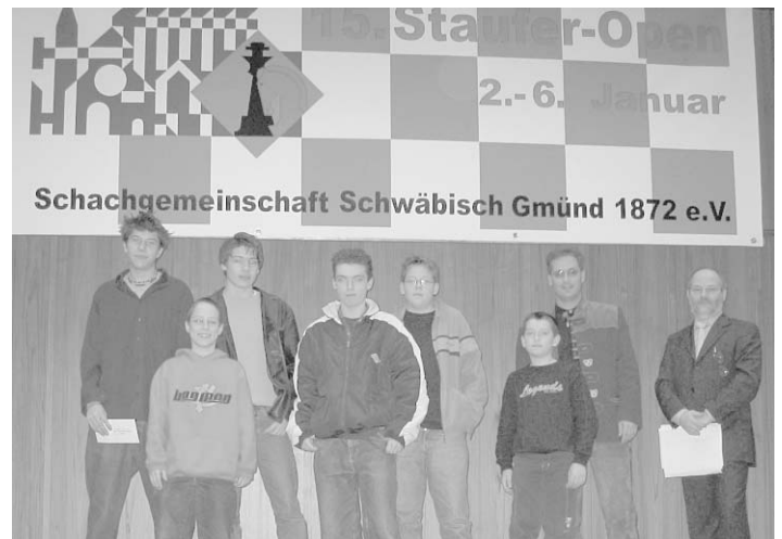
Den Jugendmannschaftspreis gewann Turm Albstadt