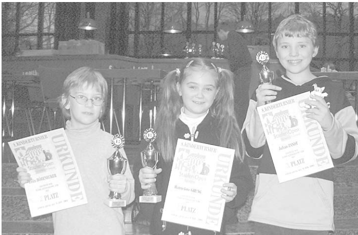
Die Siegerinnen/Sieger U10

(Alle Ergebnisse sind auf der Homepage der Veranstalter www.stauforo-pen.de nachzulesen.)