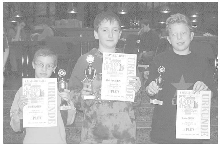
Die Siegerinnen/Sieger U12