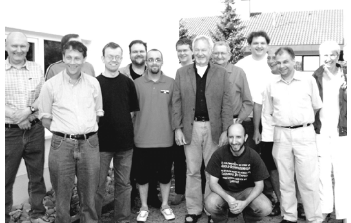
Gruppenbild mit Dame : Die neue Führungsriege des Bezirks.